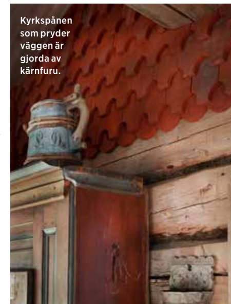
Kyrkspånen som pryder väggen är gjorda av kärnfuru.