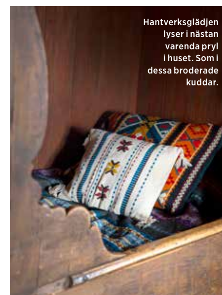
Hantverksglädjen lyser i nästan varenda pryl i huset. Som i dessa broderade kuddar.