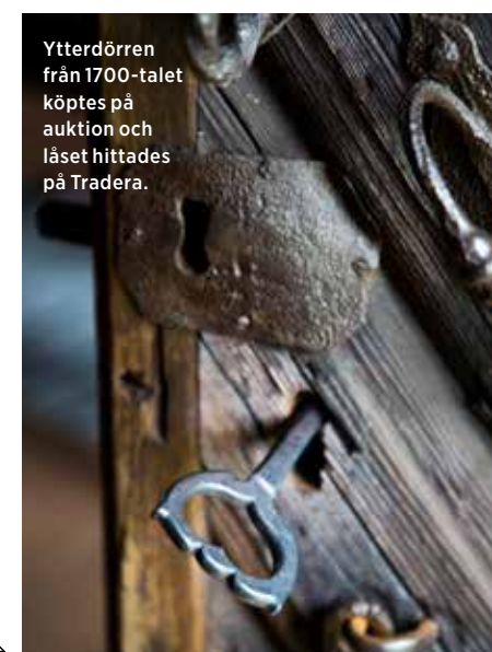
Ytterdörren från 1700-talet köptes på auktion och låset hittades på Tradera.